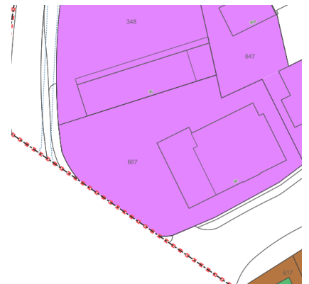
Abbildung 2: Änderung für die 2. öffentliche Auflage.