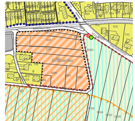
Abbildung 4: Juraschutzzone im Bauzonen- und Gesamtplan.