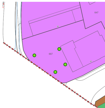
Abbildung 1: Stand öffentliche Auflage