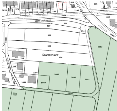
Abbildung 3: Juraschutzzone im kant. Richtplan.