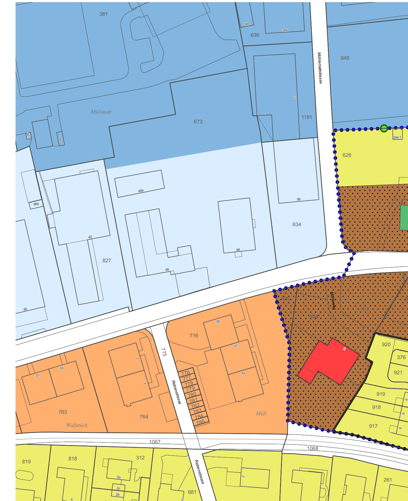
Bauzonen- und Gesamtplan: Stand 2. öffentliche Auflage (orientierend)