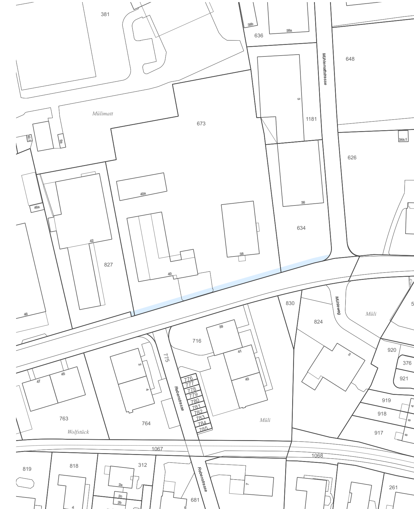
Änderung Bauzonen- und Gesamtplan (verbindlicher Planinhalt)